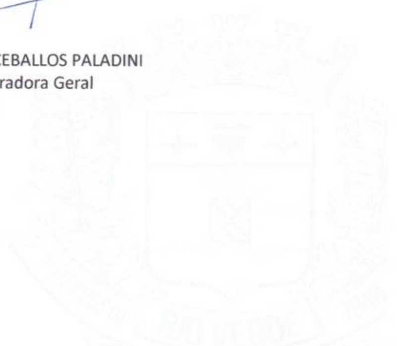
FRANCIELE CEBALLOS PALADINI Procuradora Geral

Rio Verde-GO aos 06 dias do mês de janeiro de 2025.