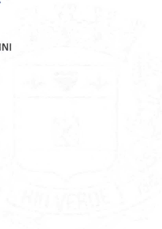
FRANCIELE CEBALLOS PALADINI Procuradora Geral

Rio Verde-GO aos 27 dias do mês de maio de 2024.